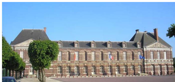
Seule l'aile gauche du château des Matignon à Torigni-sur-Vire (50) subsiste. C'est aujourd'hui la mairie de la ville.