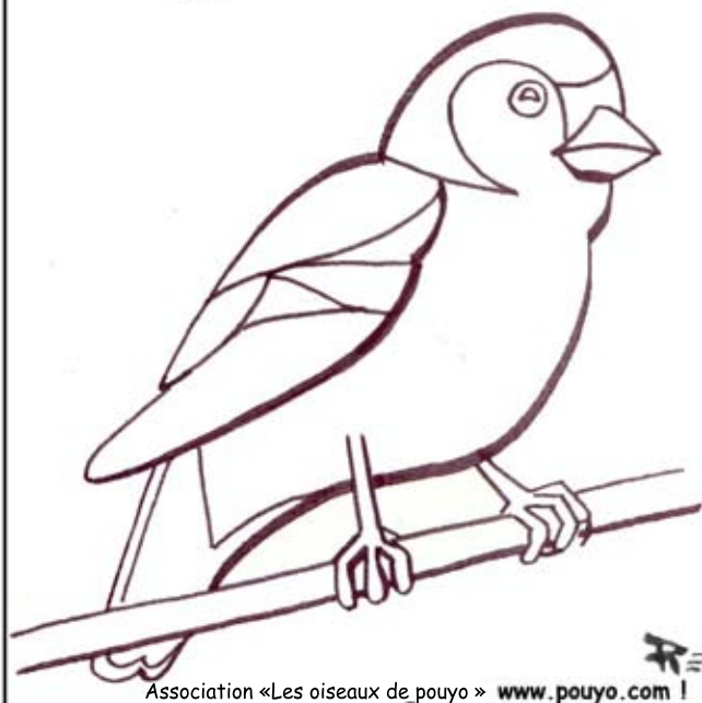
Association «Les oiseaux de pouyo» www.pouyo.com !