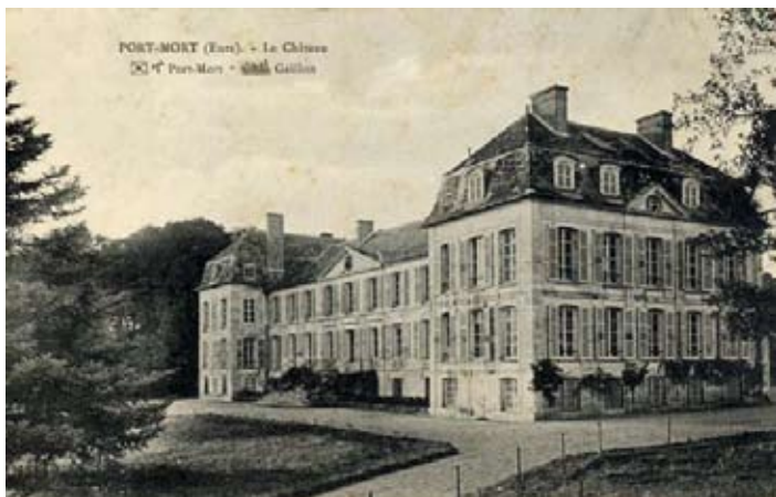
Même si aucun document n'atteste du nom du donneur d'ordre ni de la date de construction exacte, le château de Port-Mort, a vraisemblablement été édifié au XVII e , et il n'est pas impossible que Grimoult, propriétaire du fief de la Motte dans lequel il se situe, en ait été l'initiateur.

Pour découvrir plus en détail son histoire et par la même occasion le lieu de tournage d'un célèbre film de 1957 qui a fait