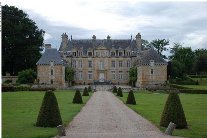
Le château de la Motte à Acqueville (14) construit par Nicolas Grimoult, alors propriétaire du fief de la Motte à Port-Mort, est un bel exemple du début de l'architecture classique française.

Après ce bref point d'anecdotes historiques, qui nous montre l'importance de cette famille sur plusieurs siècles d'histoire, je vous propose un retour touristique dans l'histoire qui a lié longtemps notre village de Port-Mort avec des seigneurs de Bretagne.