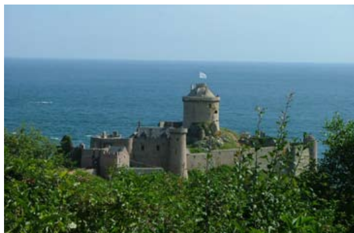
Surplombant la baie de St-Malo, le château de la Roche-Goyon, devenu Fort-La-Latte, fut érigé lors de la guerre de succession de Bretagne au XIV ème siècle, sur la base féodale du fortin construit vers 931 par la famille de la Motte Goyon.

La maison de Goyon se maintint sur le trône monégasque jusqu'en 1949, date de la mort du prince Louis II de Monaco (1870-1949), qui mourut sans postérité légitime mais en laissant une fille naturelle, Charlotte (1898-1977), qui se maria avec Pierre de Polignac (1895-1964), dont elle eut un fils, Rainier (né en 1923) qui devint en 1949 le prince souverain Rainier III de Monaco, sa mère ayant renoncé à ses droits en 1944. Depuis 1949, c'est donc la maison de Chalençon de Polignac qui a pris en main la petite principauté.