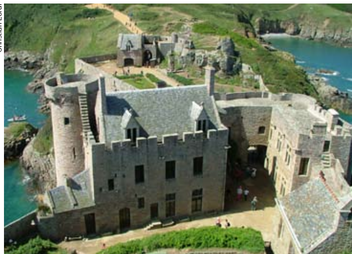
L'entrée de Fort-la-Latte, vue du donjon. Fort de défense côtière magnifiquement entretenu, il en subsiste les remparts, les tours, les courtines et les ponts-levis.

C'est le 30 septembre 1719, que l'on peut dater la naissance de l'hôtel Matignon, à Paris. En effet, son propriétaire de l'époque, le prince de Tingry, maréchal de France, fait appel à Jean Courtonne pour construire l'édifice. Le coût élevé des travaux oblige le prince à vendre le domaine à Jacques Goyon, seigneur de Matignon, qui prend en charge l'achèvement des travaux jusqu'en 1725.