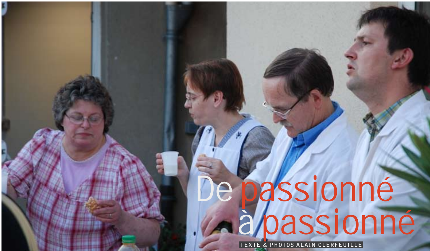
TEXTE & PHOTOS ALAIN CLERFEUILLE