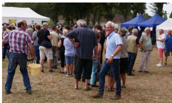
■ Trois grands acteurs de la manifestation en instantané !