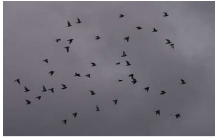
■ Lâcher de pigeons par des colombophiles locaux dans un ciel menaçant