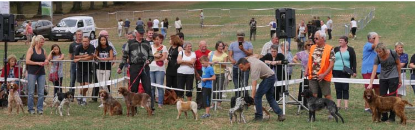
■ Présentation de chiens.