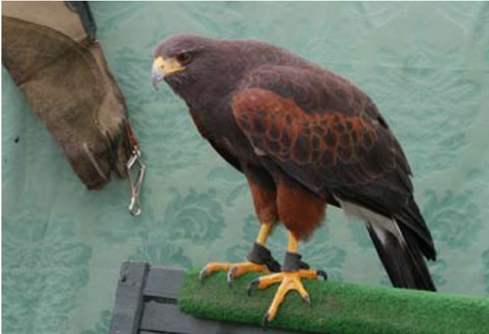
■ L'aigle du Mexique de Laure Ducasse.