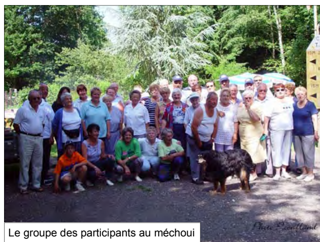
Le groupe des participants au méchoui