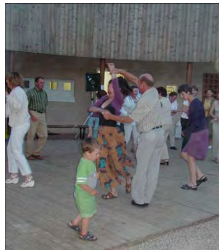
Rock'n'roll endiablé pour soirée estivale !

Cela fait plusieurs années que le Comité des Fêtes leur fait confiance : Les Produits du Soleil « La Vraie Paëlla ! » 5, rue du Pommier aux Loups • 27800 Hecmanville 02 35 62 03 23