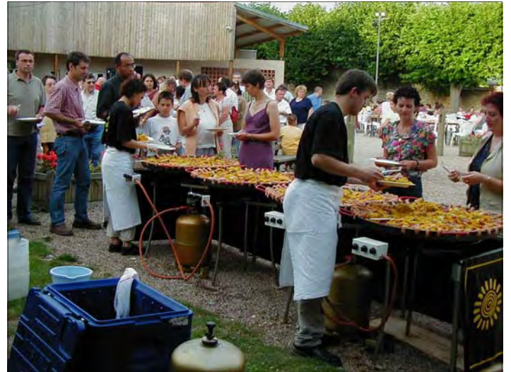
Après l'apéritif offert par la Commune, la restauration..!