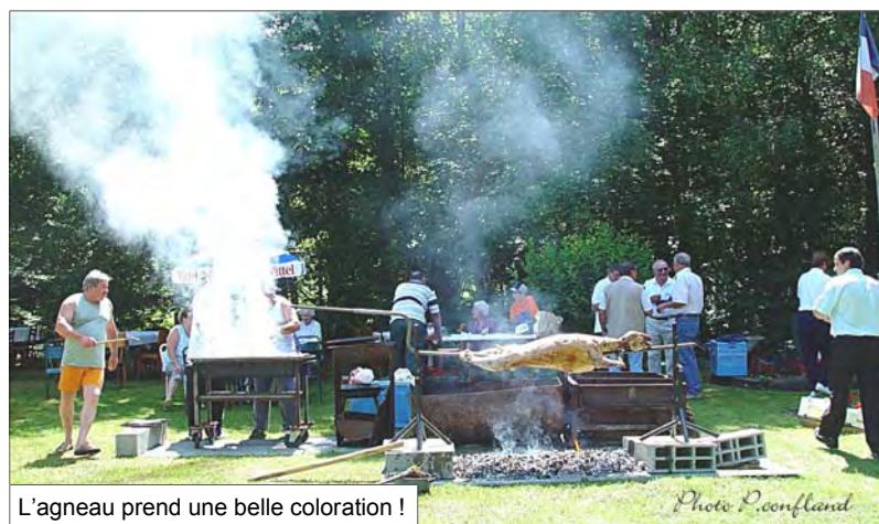
L'agneau prend une belle coloration !