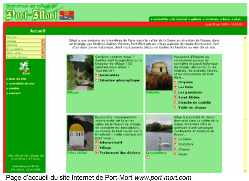
Page d'accueil du site Internet de Port-Mort www.port-mort.com

☞ A votre service ( l'annuaire qui parait dans le journal de Port-Mort, l'interactivité en plus ! Avec accès aux données par rubrique générique (commerces, artisans...) ou par corps de métier (maçonnerie, plomberie...) et liens vers les sites Internet le cas échéant