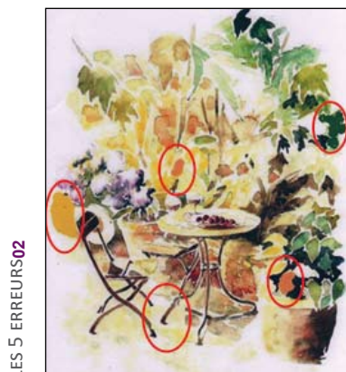
LES 5 ERREURS02

LE BRÛLAGE DE DÉCHETS MÉNAGERS est interdit toute l'année.