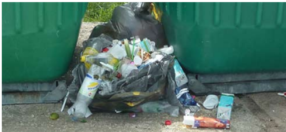
Constat déplorable au pied des conteneurs rue de Falaise le 19 juin 2012

* jean-foutre nom masculin invariable Pop. Homme incapable, sur qui on ne peut compter. © LAROUSSE